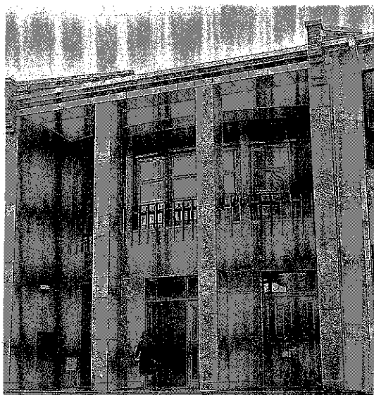
図書館閲覧室玄関