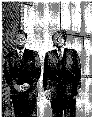
大場文理学部長と大宮助教授