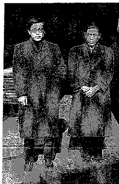
左・大宮助教授 右・木本講師